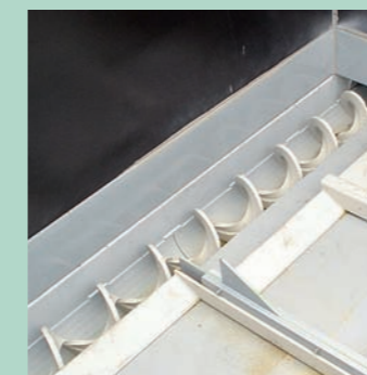
Plancher convoyeur hydraulique avec vis sans fin d'extraction