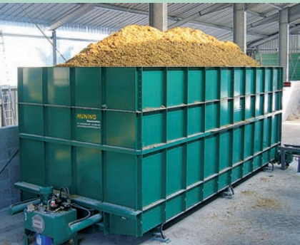
Conteneur de réception à plancher convoyeur SBC, 80 m 3