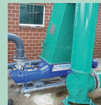
Un raccordement d'un convoyeur hydraulique avec pré-broyage