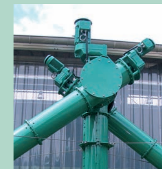
Vis sans fin verticale avec 2 vis sans fin d'introduction dans le fermenteur