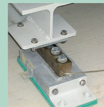
Pesage par barre de pesage