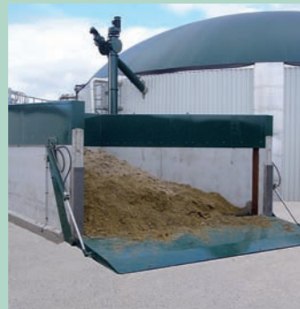
Container récepteur carrossable en béton avec rampe de fermeture hydraulique