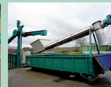
Installation de démonstration et de test Huning, vis d'alimentation à tamis