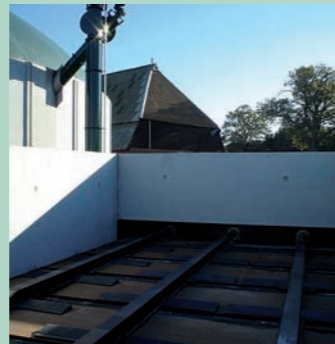
Container à plancher d'alimentation en béton