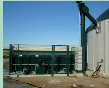
Container en béton à plancher d'alimentation combiné à un système récepteur préfabriqué