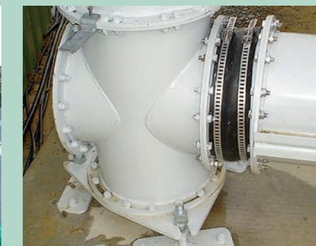
Découpage de la vis sans fin verticale pour le pesage