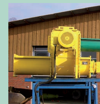
Désintégrateur à biomasse