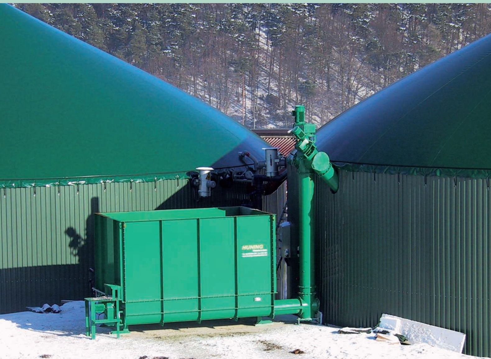
Conteneur de réception à plancher convoyeur SBC, 17 m 3